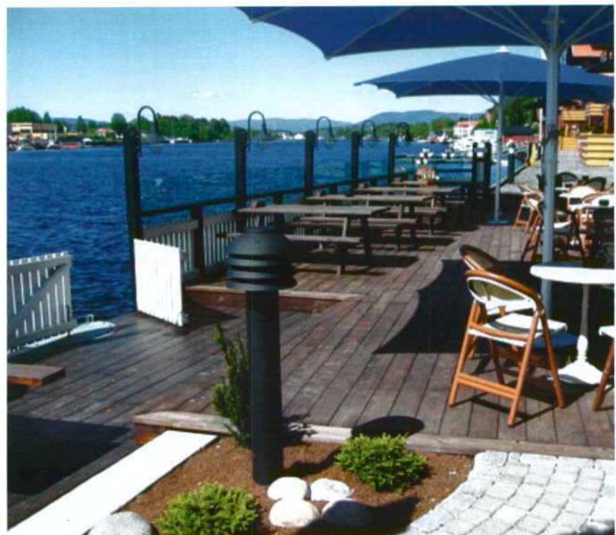
> Figura 2: Madeira furfurilada Kebony.