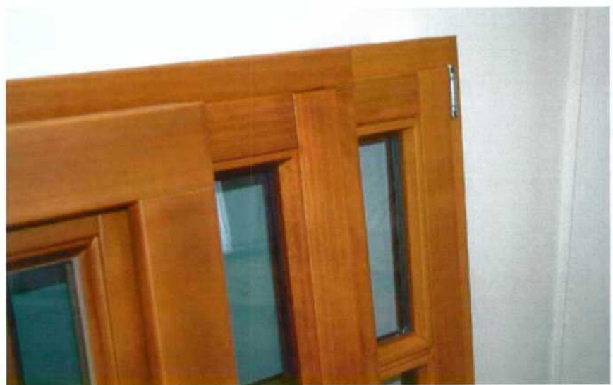
> Figura 1: Madeira acetilada Accoya™.

Os dois principais processos de modificação química resultando em produtos comer-