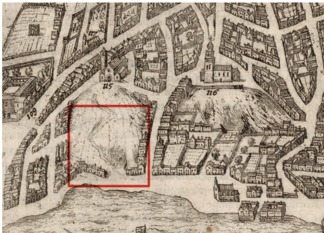
Figure 3. In the bird's eye view of Lisbon published by Georg Braun ca. 1598 [26] one can see in the detail above the area of the Boa Vista Beach, a name that survives today in the Rua da Boavista . The area known as Casas Caídas ( Fallen Houses ) derived its name from the sliding earth of the Santa Catarina hill – from the river, its shape resembled ruins of collapsed houses. At the bottom of the slope, on the left side of the Casas Caídas , two constructions stand for their high chimneys, the tallest in the drawing of this area of the chart. They could hypothetically correspond to the dwelling where was the kiln that fired glazed pottery and the place where the narrative of Marçal de Matos takes place. The dwelling is separated from most other houses, an important aspect if we bear in mind that kilns at work would not be pleasant neighbours. On the other side, the clay of the hill and the water of the fountains nearby would have made this a very suitable location for pottery workshops. The Convento da Esperança , near which João de Góis lived in 1565, is marked “109”

It is in the 1575 denunciation to the Inquisition by the painter Marçal de Matos (1554-c.1613) that we find that Filipe was a master of glazed ceramics (“mestre de louça vidrada”) but again there is no specific reference to azulejos, although we may hypothesize that anyone working in faience might conceivably also handle the specificities of azulejo manufacture, particularly in his case, since his own brother worked in the field. The denunciation had no sequence and therefore Filipe was never incarcerated or even questioned.