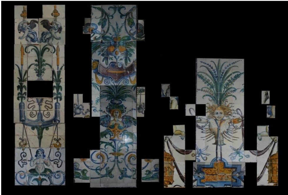
Figura 1 - Reconstituição de três painéis a partir dos azulejos dispersos in situ na antecâmara da Igreja da Graça

A mesma campanha permitiu identificar o monograma do artífice (presume-se que pintor ou mestre de faiança ou, talvez, ambas as coisas) que se ilustra na figura 2.