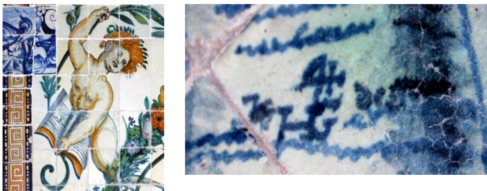
Figura 2 - Localização do monograma num livro e vista ampliada

A mesma campanha permitiu identificar o monograma do artífice (presume-se que pintor ou mestre de faiança ou, talvez, ambas as coisas) que se ilustra na figura 2.