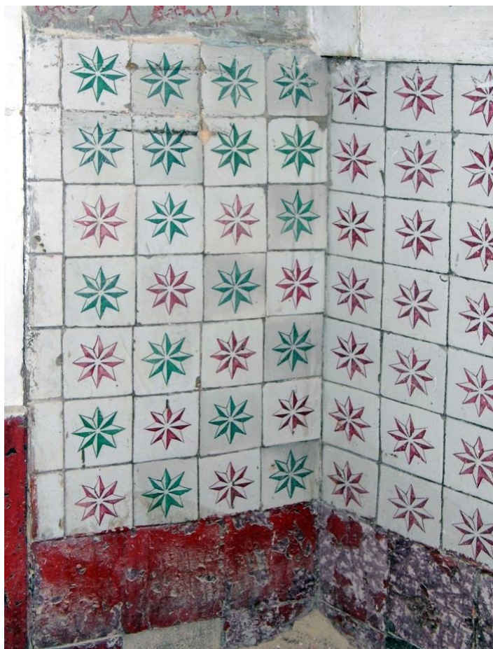
Figura 6- Azulejos de pequenas dimensões (cerca de 8 cm) com padrão estrela idêntico e na mesma combinação de cores utilizada no Palácio da Pena e para aí enviados em 1867. Estes azulejos não têm defeitos e constituem muito provavelmente remanescentes dos fornecimentos para a obra desse palácio.

Foram também reconhecidos padrões que ocorrem na Pena e no Beau Séjour mas em combinações de cores diferentes (figura 8), em aplicações semelhantes às apresentadas noutras áreas de serviços ou de lazer e ainda diversos azulejos soltos.