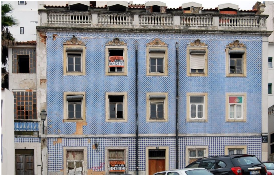
Figura 1- A “Casa das Bolas” na época em que se encontrava em venda (Nov. de 2012)