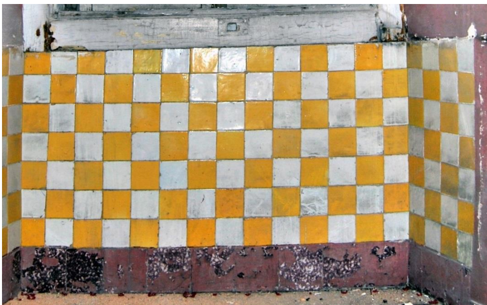
Figura 7- Axadrezado de azulejos de pequena dimensão utilizado pela Fábrica Roseira em diversas combinações de cores. Estes pequenos azulejos amarelos foram utilizados, tanto no Beau Séjour , como no Palácio Pena (aqui datados de 1867) em revestimentos exteriores.