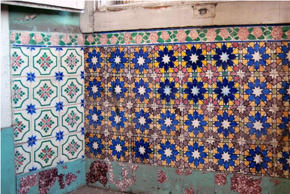
Figura 5- Azulejos de padrão neo-mourisco utilizados na Fonte dos Passarinhos e na fachada do Palácio da Pena. Note-se, nesta imagem, a existência de uma segunda combinação de cores, utilizando um pigmento rosa em vez do vinoso de manganês, que não se conhece da Pena, bem como o friso (padrão de rosas) também com a cor defeituosa.

Igualmente produzidos cerca de 1867 para o preenchimento da Sala de Jantar do Palácio da Pena (era então proprietário Eugénio Roseira, irmão do dono da “Casa das Bolas”), são os azulejos em forma de estrelas, em verde e rosa, que também se podem encontrar numa outra janela deste edifício (figura 6). Sabemos pela documentação que para o Palácio foram fornecidos cerca de 11.500 unidades [6].