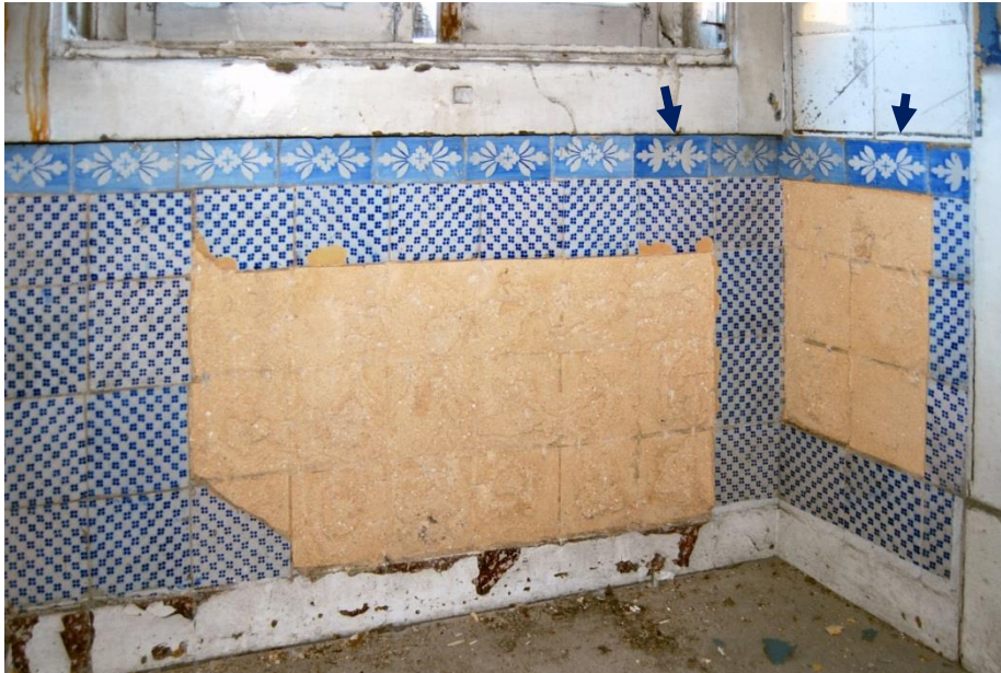
Figura 4- Padrão de pequenas flores azuis usado no Beau Séjour e em outros edifícios desde, pelo menos, o início da década de 1850. Neste caso os azulejos de fachada não parecem defeituosos, mas os do friso, um padrão muito utilizado pela Fábrica Roseira, sim: o azul de cobalto tem um tom demasiado claro ou a decoração incompleta (como ocorre com aqueles que surgem sinalizados na imagem).