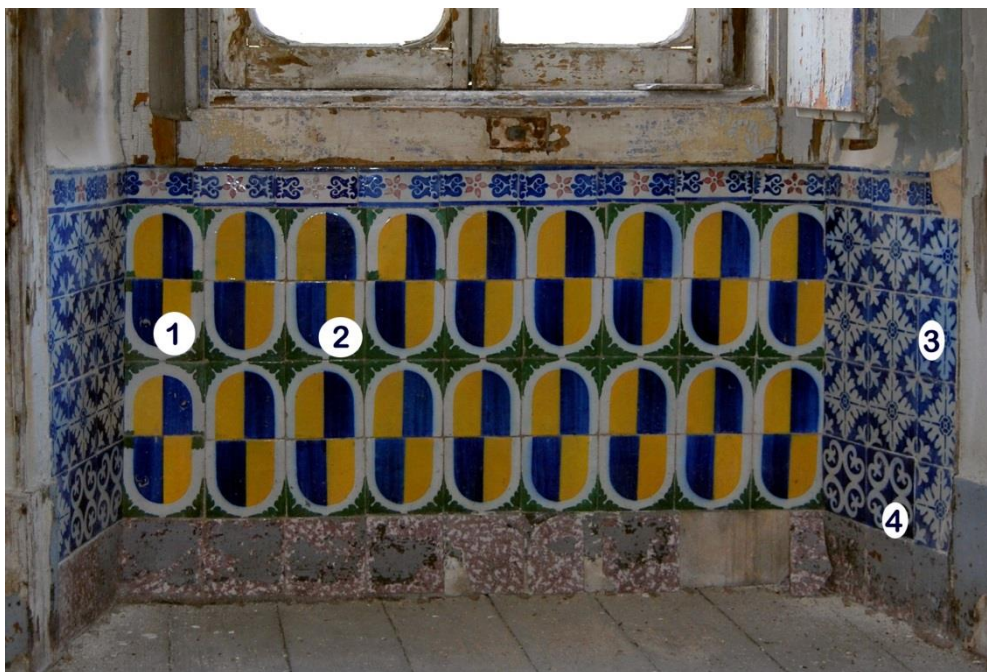
Figura 3- Quatro padrões de azulejos e dois de frisos diferentes colocados na base do parapeito de uma das janelas

No exemplo da figura 3, o primeiro com que deparamos ao entrar numa das habitações, reconhecem-se quatro padrões diferentes, dos quais dois são variantes, e um esponjado. Os padrões 1 e 2 foram utilizados noutras obras como revestimento sob cornijas. Um raro exemplo de um padrão duplo é o da fachada do Palácio do Beau Séjour em Lisboa, onde foi utilizado o tipo indicado por “1” na figura 3. Observa-se ainda duas variantes de um friso.