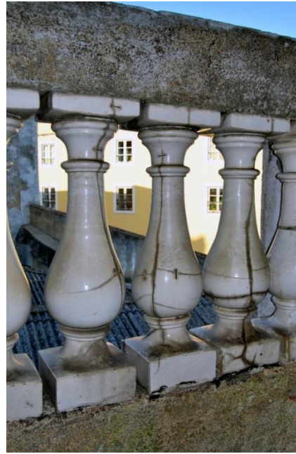
Figura 2- Balaústres cerâmicos colocados no remate da fachada da “Casa das Bolas” e onde são visíveis as inúmeras fracturas e gatos que indiciam o seu reaproveitamento

Os balaústres são, como se reconhece, reaproveitamento de refugo da fábrica ou, talvez dessa pré-existência, recuperado com gatos, e isto apesar, frise-se, do facto de o edifício pertencer ao irmão do dono da fábrica, que a viria a dirigir alguns anos mais tarde, entre 1885 e 1895, conforme investigação de Luisa Arruda [3]. De acordo com Charles Lepierre a produção de azulejos e balaústres na fábrica ter-se-á iniciado cerca de 1840 [4].