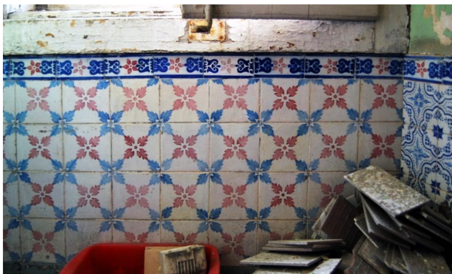
Figura 8- Padrão comum da Fábrica Roseira, muito copiado por outros fabricantes, utilizado no Beau Séjour nas cores vinho e azul escuro e também, nas cores amarelo e verde, no Palácio da Pena, estes datados de 1867