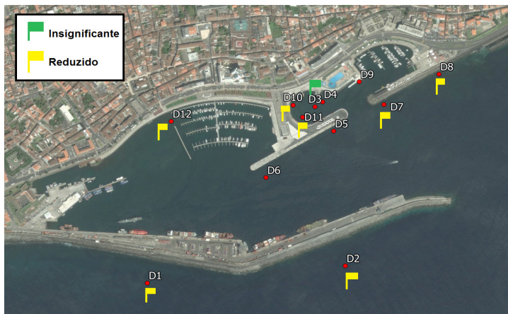
Figura 3 - Mapa de risco.

Verifica-se que o risco de galgamento é reduzido para a maioria das secções analisadas, sendo necessário, no pior dos cenários (risco reduzido), uma investigação detalhada e análise de custo-benefício, bem como a monitorização desse risco.