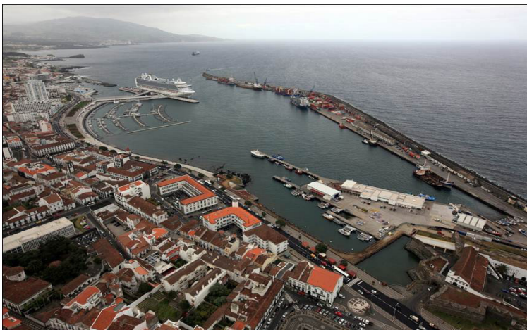
Figura 1 - Fotografia aérea do porto de Ponta Delgada (Silva, 2012)

Em situação de tempestade, a ocorrência de galgamentos é frequente neste porto, principalmente na zona do molhe principal, com consequências ao nível da operacionalidade portuária e da segurança de pessoas e bens. Por essa razão, a avaliação do risco de ocorrência de galgamentos/inundações para este porto é fundamental, de modo a dotar as entidades responsáveis da informação necessária para o planeamento e gestão desta zona.