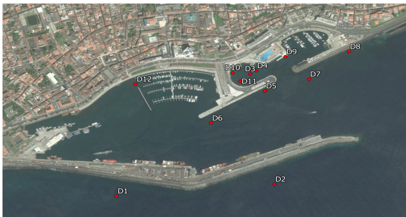
Figura 2 - Estruturas selecionadas para avaliação do risco.