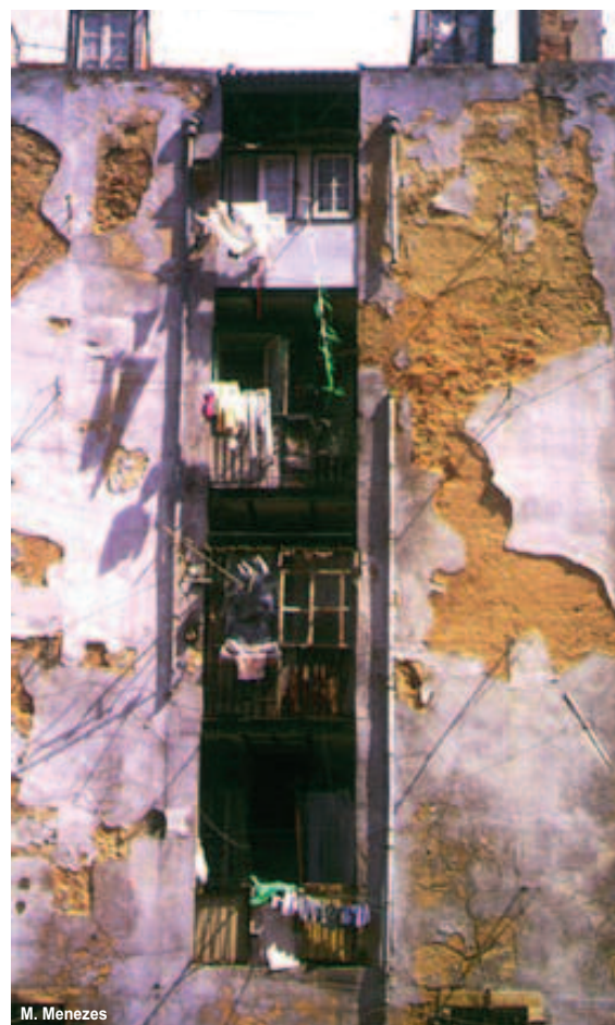
fig. 4 Immeuble dégradé du quartier de la Mouraria