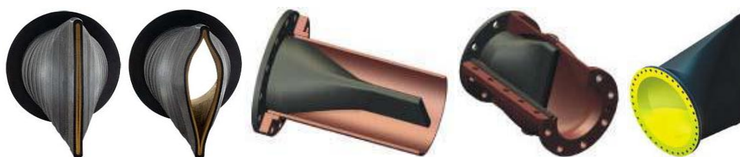
Figura 2. Válvulas elastoméricas do tipo bico-de-pato