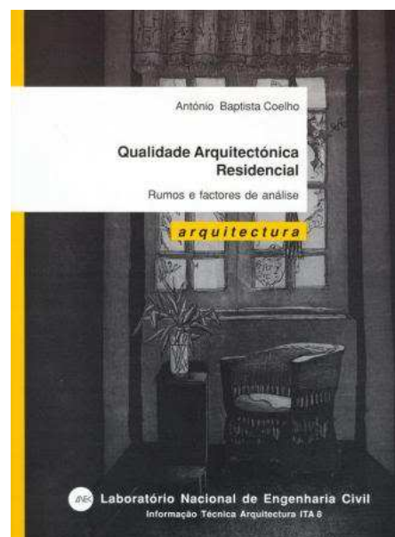
Fig. 01: capa da edição do LNEC "Qualidade Arquitectónica Residencial - Rumos e factores de análise" - ITA 8, referindo-se, em seguida, o respectivo link para a Livraria do LNEC http://livraria.lnec.pt/php/livro_ficha.php?cod_edicao=52319.php

Salienta-se ser possível aprofundar estas matérias num estudo editado pela livraria do LNEC - intitulado "Qualidade Arquitectónica Residencial - Rumos e factores de análise" - n.º 8 da colecção Informação Técnica Arquitectura, ITA 8 - que contém um desenvolvimento sistemático dos rumos e factores gerais de análise da qualidade arquitectónica residencial, que se devem constituir em objectivos de programa e que correspondem à definição de características funcionais, ambientais, sociais e de aspecto geral a satisfazer para que se atinja um elevado nível de qualidade nos espaços exteriores e interiores do habitat humano.