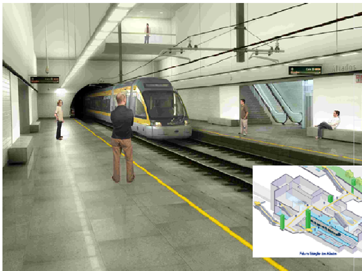
Figura 2 – Estação dos Aliados

sendo t o tempo em segundos, não ultrapassando o pico de 14 MW.