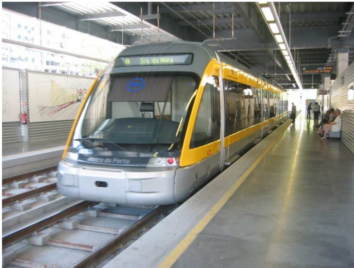
Figura 3 - Veículo utilizado no Metro do Porto

Dos resultados da demonstração do desempenho decorre a elaboração de procedimentos, que especificam as acções que devem ser assumidas pelos agentes e sistemas do Metro do Porto nas várias situações consideradas, nomeadamente em situações de emergência.