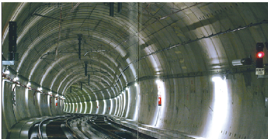
Figura 5 – Túnel e seus equipamentos