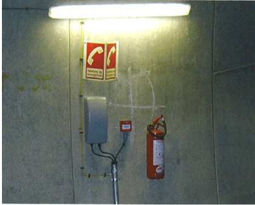
Figura 6 – Posto de emergência