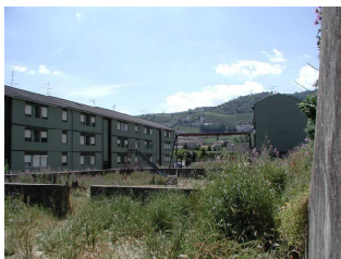
ALAGOAS | Antes da intervenção