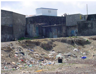
RABO DE PEIXE | Antes da intervenção