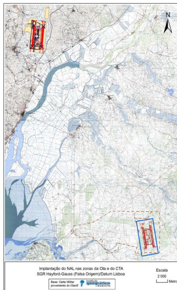
Figura 1 - Localizações alternativas do NAL (zonas da Ota e do CTA)

Na Figura 1 apresenta-se, sobre uma base cartográfica, os pontos de localização da infra-estrutura aeroportuária, em ambas as localizações estudadas.