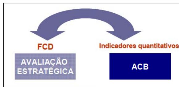
Figura 2 - Interação entre a avaliação estratégica e a ACB

A Análise Custo - Benefício é aplicada ao nível estratégico da avaliação das duas opções de localização mutuamente exclusivas e assenta sobre a metodologia de avaliação estratégica, tal como ilustrado na Figura 2 ilustra a interligação entre a ACB e a Avaliação Estratégica (AE).