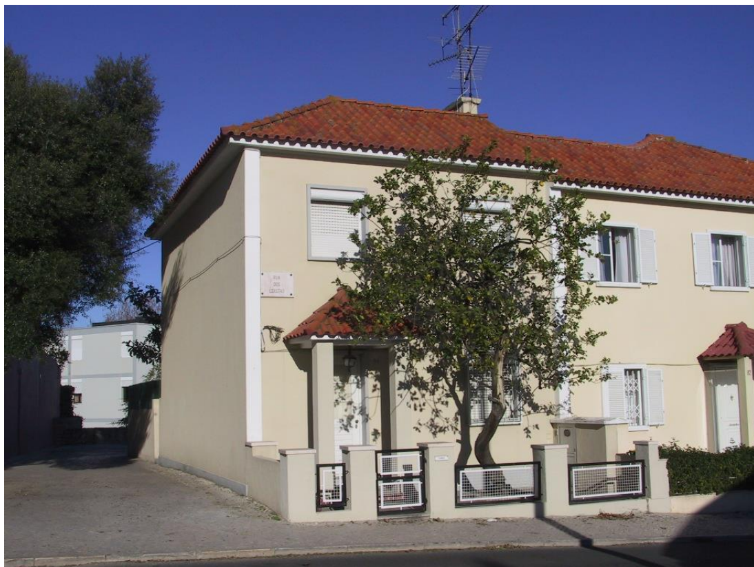
Fig. 3 – Bairro da Encarnação, em Lisboa; projeto de Paulino Montez (Rua dos Lojistas).

Mas antes de aí chegar, passamos, então, de meados da década de 1930 até meados da década seguinte e podem-se referir vários bairros de “casas económicas” dos quais é exemplo – essencialmente pela significativa dimensão, caracterizada estrutura urbana, cuidadoso equipamento coletivo e também pontuais explorações tipológicas –, o grande Bairro da Encarnação, com cerca de 1100 edifícios unifamiliares, grande parte deles geminados dois a dois e algumas excelentes bandas entremeadas de agradáveis pracetas residenciais (na Rua dos Lojistas), desenhado por Paulino Montez, logo à entrada Norte de Lisboa; bairro este que, no entanto, durante bastante tempo, parece ter tido ligações à cidade bastante deficientes.