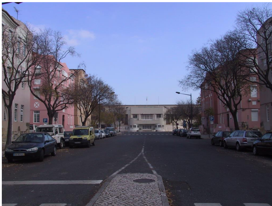
Fig. 1 – Bairro Social do Arco do Cego, em Lisboa; projecto de Edmundo Tavares e Frederico Machado.

O Bairro Social do Arco do Cego (BSAC) em Lisboa, com os seus quase 500 fogos, projeto de Edmundo Tavares e Frederico Machado e que se organiza em torno da belíssima peça que é o Liceu D. Filipa de Lencastre (projetado em 1932 por Jorge Segurado), foi designado como o “1.º Bairro Social de Lisboa” e tem uma escala verdadeiramente urbana e significativa; salienta-se o prazo muito dilatado de construção do BSAC, entre 1918/19 e 1935, marcado por longos períodos de paragem das obras, sendo assim acabado já em pleno Estado Novo (3).