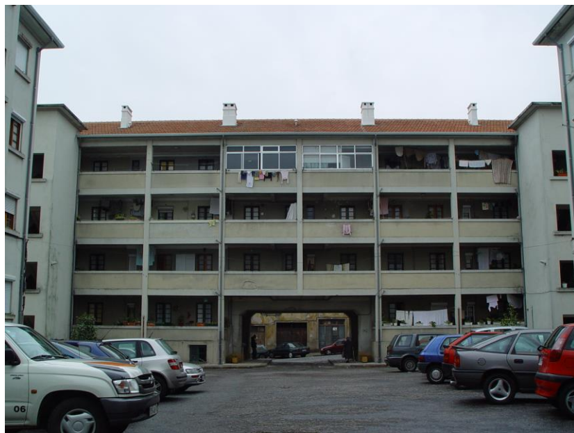
Fig. 2 – No Porto, na Rua Duque de Saldanha, projecto de Marques da Silva

Uma tal escolha tipológica proporciona a quase global disponibilização de um máximo de relações com pequenos quintais privativos, servindo um máximo de fogos (térreos e em 1.º andar).