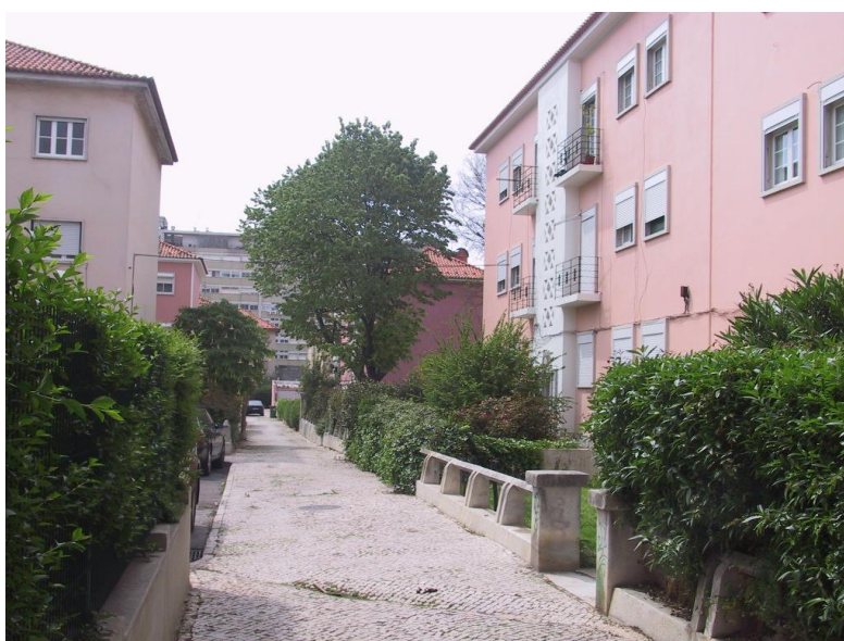
Fig. 5 – “Os mistérios de Alvalade”.