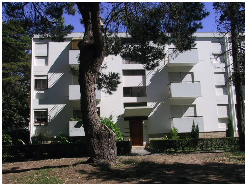
Fig. 6 – O Bairro de Ramalde, no Porto, projetado por Fernando Távora.

Portanto, uma cidade em continuidade, formal (em termos gerais) e funcional, que se liga à preexistente e que nela própria deixa espaços estratégicos para a cidade do futuro próximo.