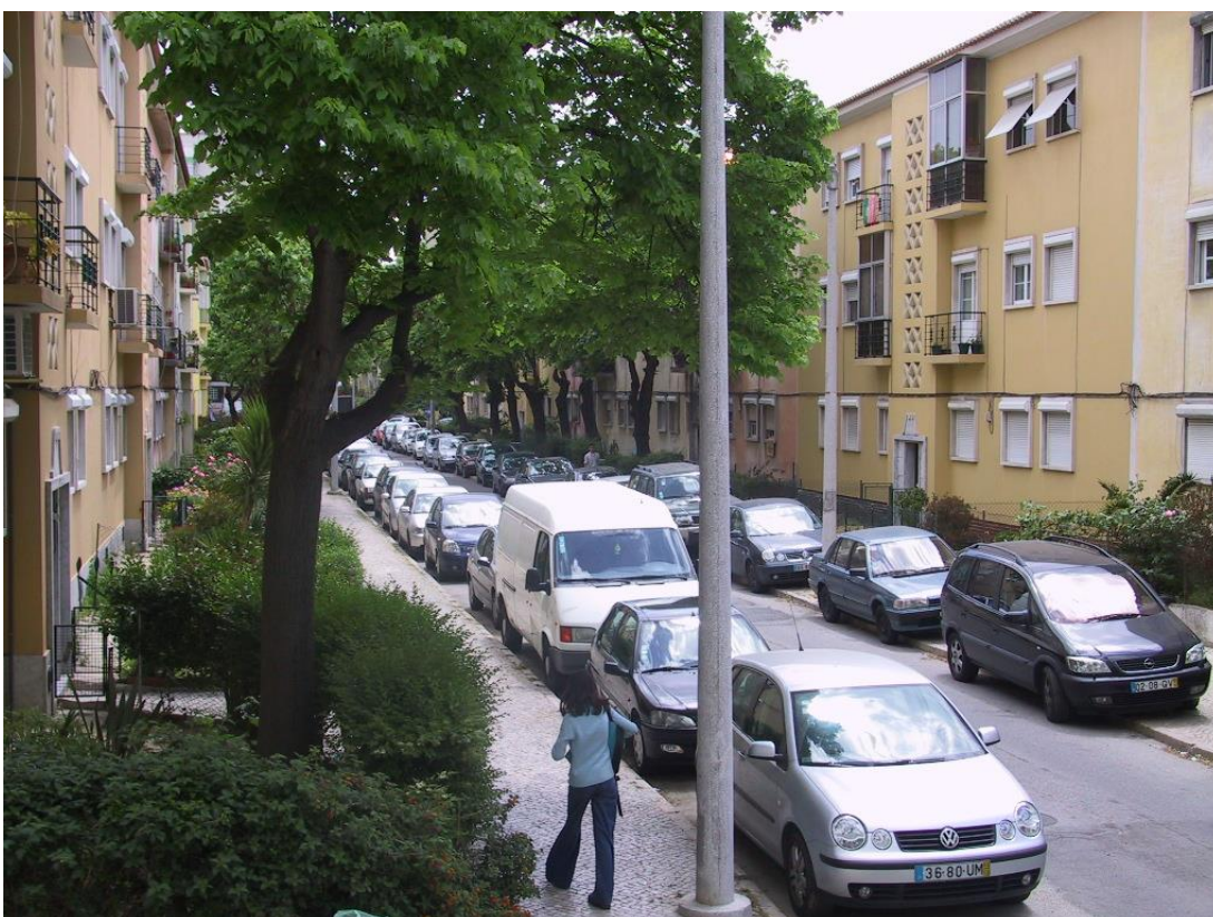
Fig. 4 – Alvalade, Lisboa, projeto urbano de Faria da Costa; uma rua residencial com edifícios das HE-FCP; uma rua sossegada e íntima, mas a dois passos da animação urbana da Av.ª de Roma.

”Não tem história, só comércio, vá lá, bombeiros e escolas para lhe dar alegria. Os jornais dizem que é uma das zonas de mais assaltos em Lisboa, mas não se vê nem sombra de polícia ... E no entanto, à primeira vista tudo é ordem e paz – o mistério de Alvalade está aí.”