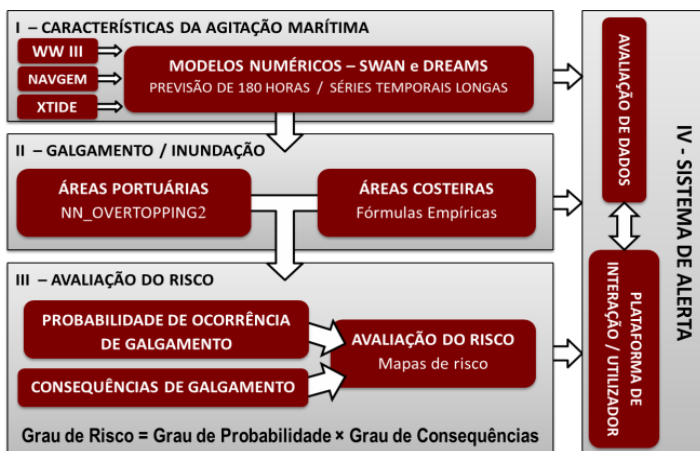
Figura 1. Esquema do sistema HIDRALERTA.

de agitação e galgamentos (ou cenários pré-definidos associados às mudanças climáticas e/ou eventos extremos) e elaboração de mapas de risco para apoio à gestão costeira e portuária; e IV - Sistema de alerta, para a análise, em tempo real, das situações de emergência e envio automático de mensagens de alerta para as autoridades responsáveis. Os protótipos do sistema estão a ser construídos para dois locais da costa portuguesa: o porto da Praia da Vitória, Terceira, Açores e a praia de S. João da Caparica, Almada.