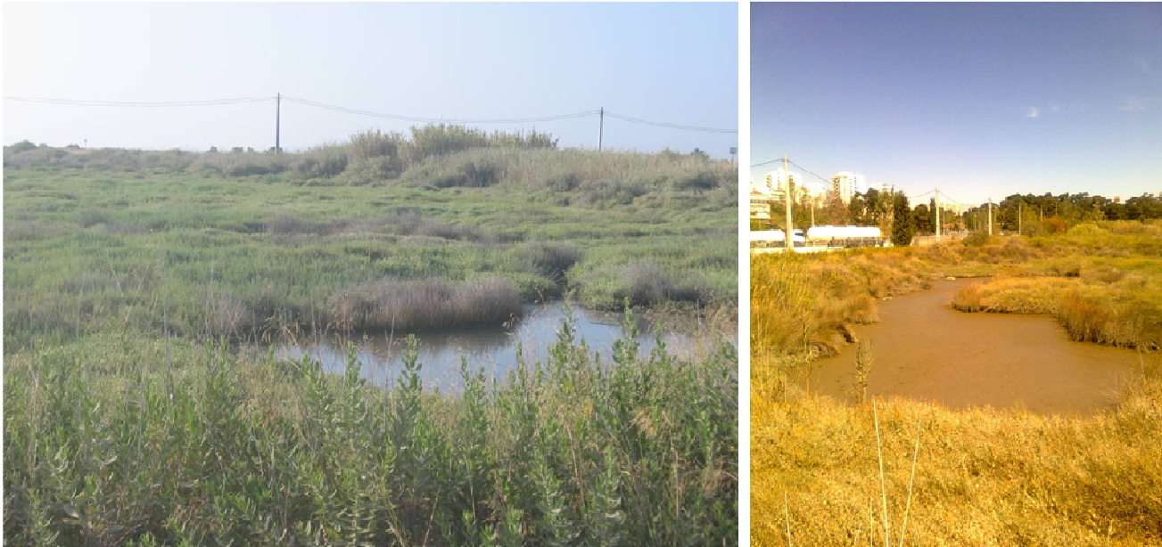
Fig.4- a) Sapal no interior das instalações da Solvay. Vista para SE; b) Aspecto de uma das valas, vista para NE (ponto sapal 2 na figura 1)

operar com o equipamento. No entanto, fez-se o levantamento topográfico de alguns pontos que materializam o limite da vegetação de sapal e transição para vegetação com características terrestres.