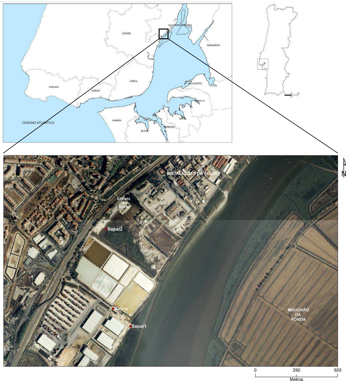
Fig. 1 – Enquadramento geográfico da área em estudo (CAOP 2010 e Ortofotos de 2007 do IGP).