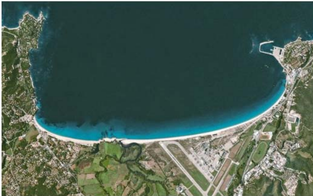
Fig.1. Praia encaixada

As praias encaixadas, frequentes na natureza, caracterizam-se por apresentarem saliências fixas nos seus extremos, suficientemente desenvolvidas para impedirem trocas significativas de areias com os trechos de costa adjacentes. Essas saliências, que podem ser formações rochosas naturais ou obras costeiras como molhes, quebra-mares ou esporões, induzem modificações na propagação das ondas nas suas proximidades, com atenuação local da energia que se dissipa na rebentação. Daí resultam alterações morfológicas, traduzidas num maior ou menor encurvamento da linha de água nos trechos extremos da praia.