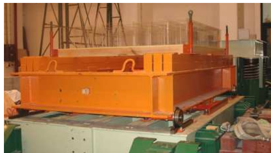
Fig. 3 – Montagem de ensaio para a realização de estudos paramétricos: plataforma sísmica, sistema de simulação e TLDs rectangulares.

quase-estático das molas de ar utilizadas como elemento elástico do simulador.